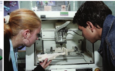
Fertigung Auf der CNC-Maschine entsteht der reale Rennwagen