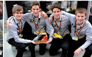
Das Erfolgserlebnis Landesmeister, Deutscher Meister, Weltmeister