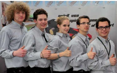
Zusammenarbeit Stärken kombinieren - Erfolg im Team

Nach Wochen der Vorbereitung gilt es all diese Elemente im Rahmen einer Regionalauscheidung einer Jury zu präsentieren und sich im Wettbewerb durchzusetzen.