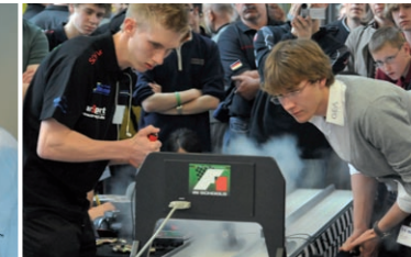
Wettbewerb Reaktionszeit, Fahrzeit - ein Teil des Wettbewerbes